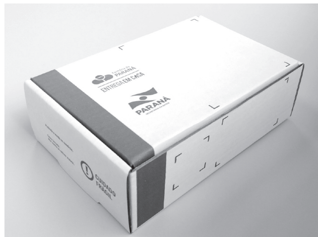
Figura 3 : Embalagem final personalizada utilizada pelo serviço.