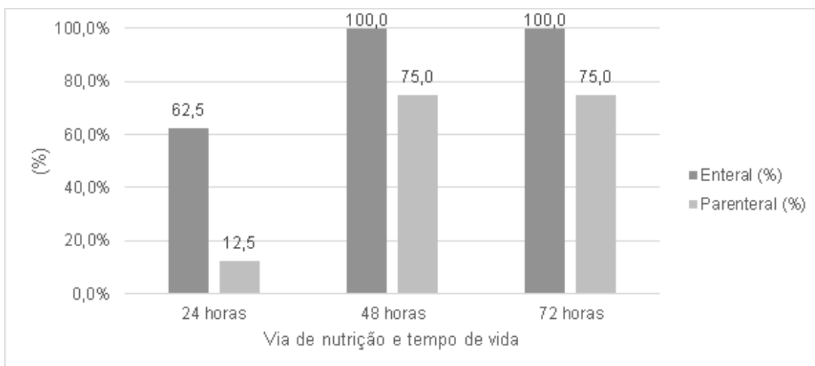
Gráfico 3. Nutrição dos recém-nascidos muito prematuros (de 28 a <32 semanas de idade gestacional) segundo a via de oferta, Unidade de Terapia Intensiva Neonatal, hospital público de ensino, Curitiba - PR, 2020